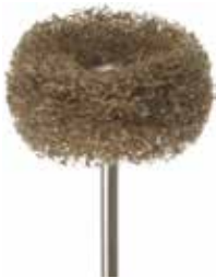
ハード 250-25HP D1