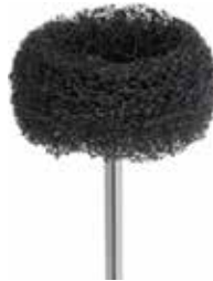
ミディアム 251-25HP D2