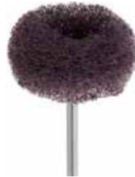
ソフト 255-25HP D3