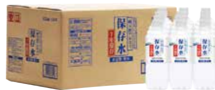
申込番号 70-D 純天然アルカリ7年保存水 保存水500ml×24本