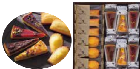
申込番号 50-A <ハリスプレミアム> タルト・焼き菓子セット タルト(3種)×各2 マドレーヌ×3、フィナンシェ×3 計12袋