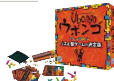
申込番号 100-E ウボンゴ スタンダード版 パズル盤ゲームの決定版