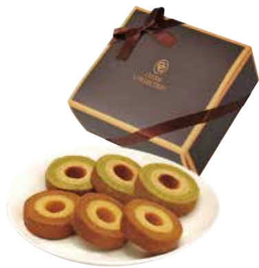
申込番号 20-B セレブコレクション2層バウムセット キャラメル&ミルク・抹茶&ミルク×各3個 計6個