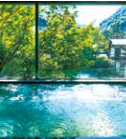
温泉日帰り入浴 + 昼食付プラン