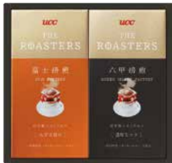
申込番号 20-A <UCC> ザ・ロースターズ (ドリップコーヒー) 六甲焙煎濃厚なコク・富士焙煎広がる甘み×各1 (各5袋入)