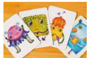
申込番号 30-C <井桁堂> スティックケーキギフト スティックケーキ (プレーン・ピスタチオ・チーズ・ラズベリー)×各2、(チョコ・ブルーベリー・レモンティー)×各1 計11個 申込番号 30-D <すこるくや> ナンジャモンジャ・ミドリ