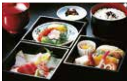
和味旬菜 三段弁当