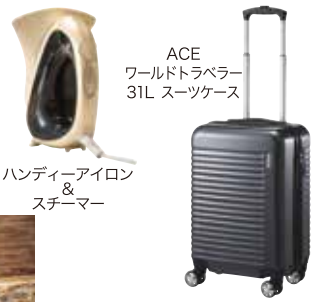
ハンディーアイロン & スチーマー