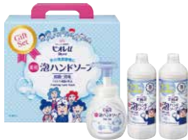
申込番号 30-B <花王> ビオレU 泡ハンドソープギフト ビオレU泡ハンドソープポンプ250ml×1、詰替用450ml×2