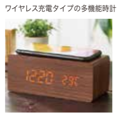
申込番号 50-D ワイヤレス充電機能付クロック ワイヤレス充電・時計・温度計・カレンダー・アラーム・振動センサー機能。単4電池×3(別売)、CR2032ボタン電池×1(内蔵)、付属品:USBコード×1