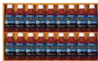
申込番号 50-B <サントリー> 黒烏龍茶ギフト 脂肪の吸収を抑え、体に脂肪がつきにくくなる特定保健用食品のウーロン茶です。黒烏龍茶350ml×18本