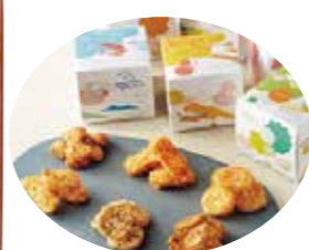
申込番号 50-E どら焼き&ヴァンフェル詰合せ パニャヴァンフェル×4、どら焼き×12(粒あん・八女抹茶あん×各6) 計16袋