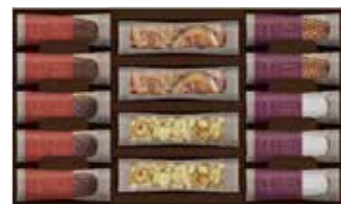
申込番号 70-C <ザ・スイーツ> ブラウンie&焼きショコラコレクション ブラウンie(オレンジ・ナッツ×各2)、ショコラオープン(とろりプレーン×2・とろりキャラメル×3・ほろりバター×3・ほろりピスタチオ×2) 計14袋