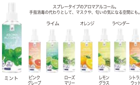
申込番号 40-B アロマアルコール ミント 申込番号 40-C アロマアルコール ピンクグレープフルーツ 申込番号 40-D アロマアルコール ライム 申込番号 40-E アロマアルコール ローズマリー アロマアルコール 100ml×1本 スプレータイプのアロマアルコール。手指消毒の代わりとして、マスクや、匂いの気になる空間にも。 ライム オレンジ ラベンダー ミント ピンクグレープフルーツ ローズマリー レモングラス シトラスウッド 申込番号 40-F アロマアルコール オレンジ 申込番号 40-G アロマアルコール レモングラス 申込番号 40-H アロマアルコール ラベンダー 申込番号 40-I アロマアルコール シトラスウッド アロマアルコール 100ml×1本