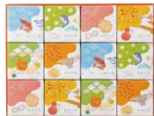
申込番号 50-C <福來の音> あげもち小町 あげもち(甘辛小丸・ごま塩小丸・だし揚げ・えび・七味・カレー)×各2箱 計12箱