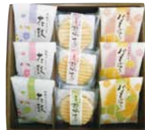
申込番号 30-F <創業 京づる> 極庵 欧風せんべい×3 (パニャ・苺・抹茶)、花鼓×3、パイまんじゅう×3 (小豆・さつまいも・栗) 計9個