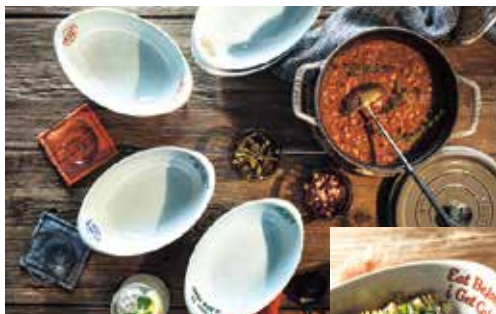
BEAMSデザイン オーバルボウル5枚セット

申込番号 200-A <ツインバード> コードレススティッククリーナー 一台3役の3WAYクリーナー。すぐに使えるコードレスタイプ。