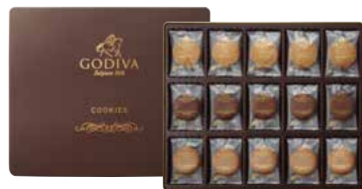
申込番号 100-C <GODIVA> クッキーアソートメント クッキー 計55袋