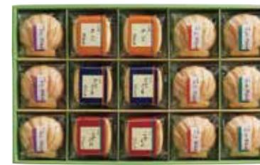
申込番号 100-B <久右衛門> 本格和風だしお吸物詰合せ 本格和風だしお吸物(ぶく・たい・ほたて×各3、かに・のどぐる・ふかひれ×各2) 計15袋