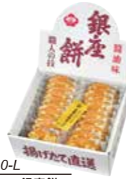
申込番号 40-L <銀座花のれん> 銀座餅 銀座餅×20袋