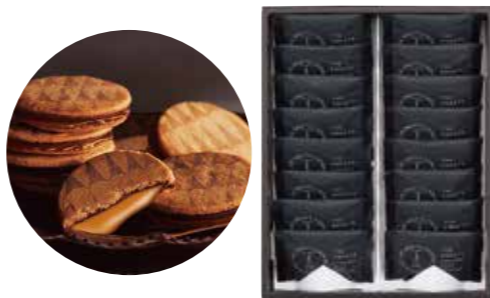
申込番号 40-A <ザ・スイーツ> キャラメルサンドクッキー キャラメルサンド×16袋