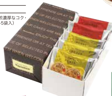
申込番号 20-C <マネケン> ワッフルギフトセット プレーンワッフル×3個、ココアワッフル×2個、計5個 (シロップ×2袋)