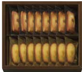
申込番号 30-A <アンリシャルパンティエ> フィナンシェ・マドレーヌ 詰合せ フィナンシェ×8個、マドレーヌ×8個 計16個