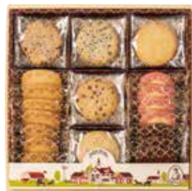
申込番号 70-B <アントステラ> ステラズセレクト M クッキー 計35袋