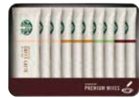
申込番号 40-K <スターバックス> プレミアムミックスギフト (スティックタイプ) カフェラテ×3、キャラメルラテ×3、カフェモカ×2、抹茶ラテ×2 計10袋