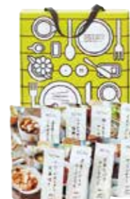
申込番号 100-D <IZAMESHI> キャリーボックスデリ きのこと鶏の玄米スープごはん・濃厚トマトのスープリゾット・大豆たっぷりカレーリゾット・梅と生姜のサバ味噌煮・トロトロねぎの塩麹チキン・名古屋コーチン入りつくねと野菜の和風煮・さるる野菜のビーフシチュー・りんごが決め手の生手焼き×各1(全てレトルト)、紙皿×2、紙スプーン×4