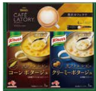
申込番号 20-E <味の素> クノールスープ&コーヒーギフト (粉タイプ)ギフトレシビのコーンポタージュ 3袋入、ギフトレシビのクリーミーポタージュ 3袋入、スティックプレミアム贅沢カフェラテ 4袋入