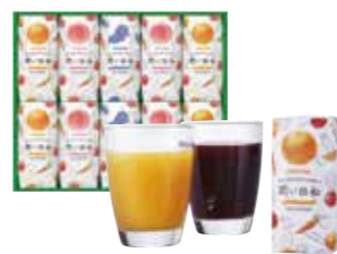
申込番号 40-J <カゴメ> 潤い日和 ホワイトピーチミックス・清見オレンジミックス×各4、コンコードグレープミックス×2 計10本