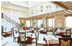
レストランシェフおすすめフルコース