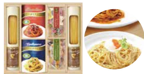
申込番号 70-A <彩食ファクトリー味わい> ソースで食べるパスタセット スパゲティ150g×2、パスタソース(ナポリタン2人前・カルボナーラ2人前)×各1、カラーパスタ(コンキリエ・ファルファレ)×各1