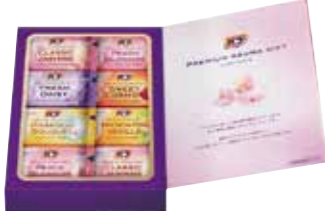
申込番号 20-D <花王> パブ プレミアムアロマギフト パブ(クラシックジャスミン・ピーチプロッサム)×各4錠、(スイートコスモス・フレッシュデイズ・マグノリアブーケ・マンダリンパニャ)×各2錠 計16錠