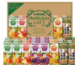
申込番号 100-A <カゴメ> 野菜飲料バラエティギフト 野菜生活100(オリジナル・ベリーサラダ)×各10、(マンゴースラダ・アップルサラダ)×各5、野菜一日これ一本×10 各200ml×計40本