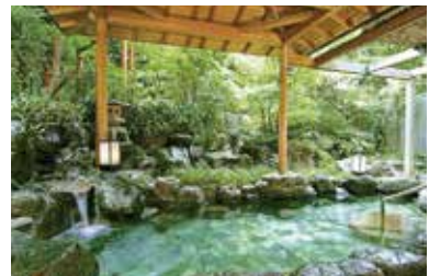
温泉リゾート食事付日帰りプラン

食事付き日帰り温泉や、多彩なジャンルのレストラン体験プランがうれしいカタログギフト。お取り寄せグルメ、高級エステや冒険心をくすぐるアウトドアなど体験ギフトも満載。掲載点数:604点