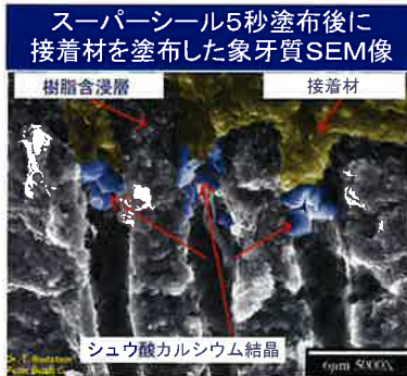
スーパーシール5秒は、樹脂合浸層の形成を阻害しません。

塗布面は結晶の厚みがなく、被膜や層を形成しませんので、各種接着材、セメントとの併用が可能で、接着強さを低下させません。