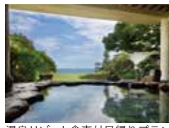
温泉リゾート食事付日帰りプラン