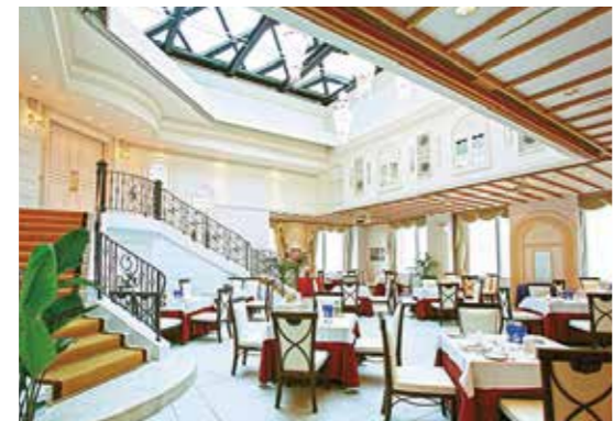
レストラン シェフおすすめフルコース