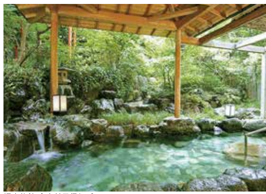
温泉旅館 食事付日帰りプラン