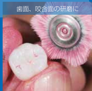
歯面、咬合面の研磨に