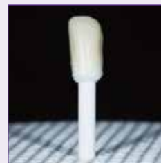
焼成用ピンに立てる (b)