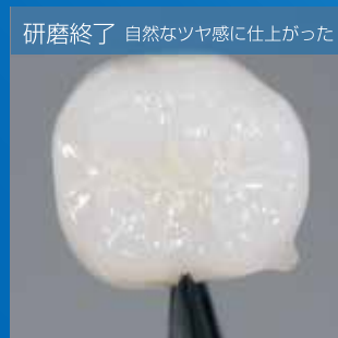
研磨終了 自然なツヤ感に仕上がった

ローズ色が歯面上に残っている箇所は未研磨部（＝砥粒が大きい）で、 研磨後は色が消える（＝砥粒がなくなる）ので、未研磨部・研磨済部の判別がカンタンです。