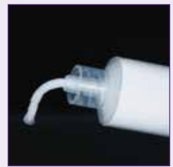
粘性のあるペースト状