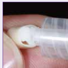
クラウン内にペーストを充填 (a)