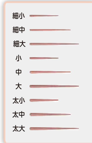
形態図：アクセサリーポイント

※印刷の都合上、実際の色とは異なって見えることがあります。 ※製品の仕様及び外観は、予告なく変更することがあります。 ※掲載の価格は2013年1月現在の標準価格(税別)です。